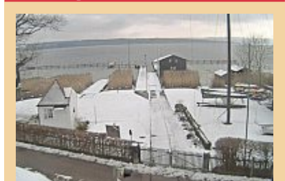
Minus ein Grad und bewölkt: So schaute es gestern um 10.55 Uhr in Utting aus.